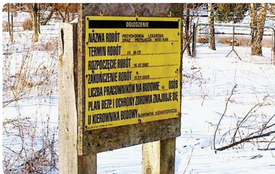
Fragment tablicy informacyjnej budowy do dziś tkwi na pustej działce. Czytamy na niej: „NAZWA ROBÓT – PRZYCHODNIA LEKARSKA ORAZ PRZYŁĄCZA WOD-KAN., ROZPOCZĘCIE ROBÓT – 16.07.2007, ZAKOŃCZENIE – 31.09.2009.

Reasumując, należy stwierdzić że problem z brakiem przychodni w Straszynie jest złożony i przede wszystkim zależy nie tylko od dobrej woli gminy, jednakże jej plany sprzyjają powstaniu w niedalekiej przyszłości takiej placówki ochrony zdrowia. A tymczasem życzę czytelnikom zdrowia!