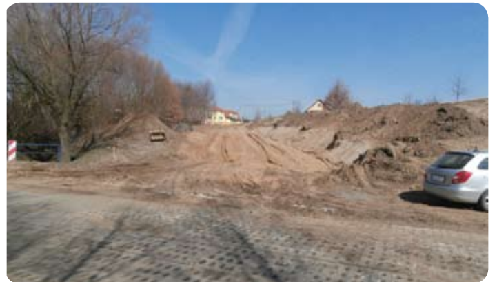
Prace ruszyły już pełną parą.