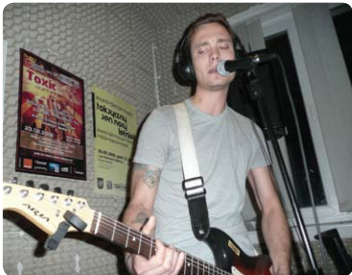
Gitarzysta i wokalista zespołu Tetrix w Toksynie FM