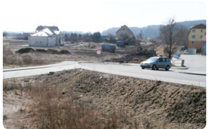
W tym miejscu rozpocznie swój bieg nowa ulica Komandora Kraszewskiego...